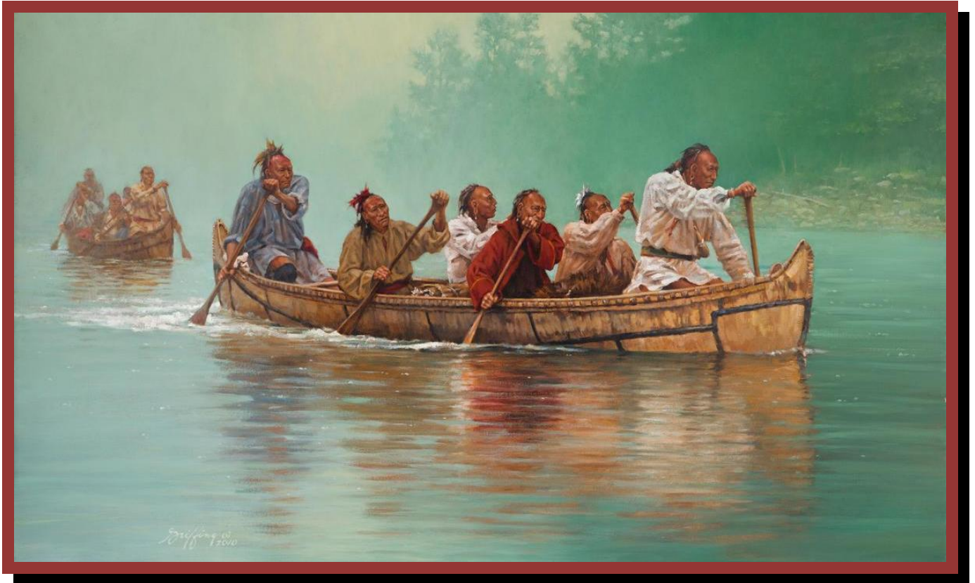
En målning av Robert Griffing som han kallat "Through the Straits"

Välkomna till 2013, till nya äventyr och till nya aktiviteter. Det här symboliserar vi med en fin bild