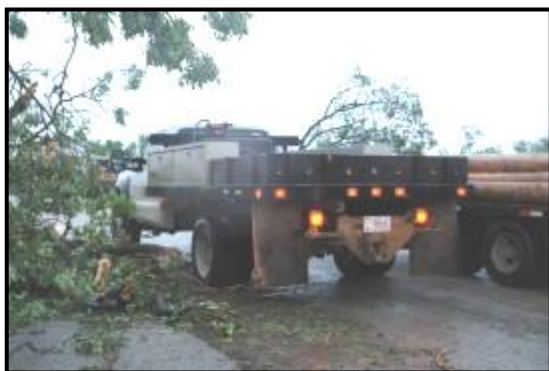
A Cherokee Nation truck squeezes through a tight spot during relief efforts for Delaware County storm victims.

They are also assisting in Joplin, just one hour north of the Cherokee Nation. Students and instructors were sent from the Cherokee Talking Leaves Job Corps and Health Occupation Trade program to assist with medical and other relief efforts. Furthermore, the Cherokee Nation is a collection point for supply donations from the public, and is collecting and distributing toiletries, water, diapers, baby formula, batteries, and other necessities. Several members of the Marshal Service are also helping with the ongoing rescue and recovery efforts in Joplin.