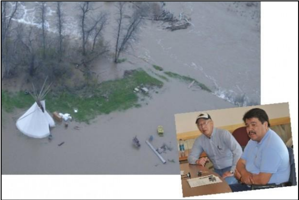
Flooding on the Crow Reservation has destroyed several dozen homes.