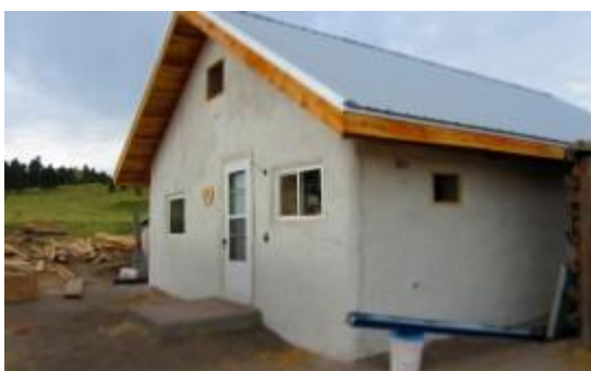
Exterior shot of the cob house

Gerald Weasel's home was constructed out of "cob," a mixture of grass, sand and clay, and straw bale.