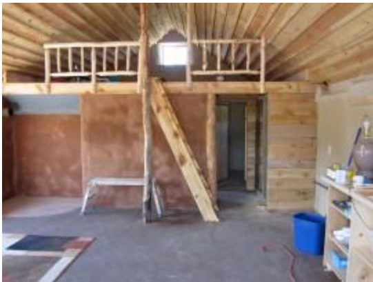
Interior of cob house

"People came and paid to learn that building style, and this is how we funded the majority of it," Freed says.