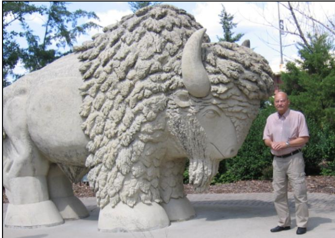
Redaktören tillsammans med den anskrämliga buffeln. Vilken som är buffeln får ni lista ut själva

Jag har börjat att skriva på den officiella reseberättelsen från vår USA-resa. Men jag måste erkänna att jag den här gången har vissa besvär med att komma ihåg alla detaljer. Vet inte vad det beror på. Tycker inte det har varit så vid tidigare äventyr. Kan det möjligen ha något med åldern att göra? Av den här anledningen skulle jag vara tacksam om jag kunde få ta del av det som jag antar att många andra redan har skrivit. Inte för att jag ska kopiera, men det skulle hjälpa mig att sortera upp i detaljminnet. Har dock kommit en liten bit och har faktiskt till och med redan hunnit skriva om flera partier. Därmed har det blivit lite material över. Till exempel den här passusen: I staden Mankato, där 38 dödsdömda siouxer hängdes i en gemensamhetsgalge