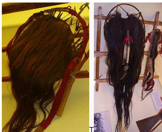
Scalps exhibited at Karl May Museum in Radebeul, Germany,

Det kan kanske vara intressant att läsa lite mera om bakgrunden till samlingen av skalper hos Karl May Museum. Den här texten finns på Wikipedia: