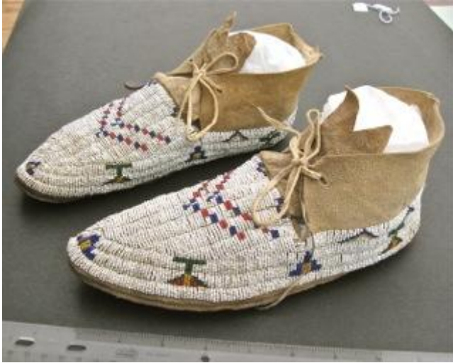
SINEW SEWN FULL BEADED CHEYENNE MOCCASINS NATIVE AMERICAN INDIAN BEADWORK c. 1890

Men kanske är de redan sålda. Det gäller att vara på hugget när det är auktion. Men att bara titta på bilder kostar ju inte så mycket.