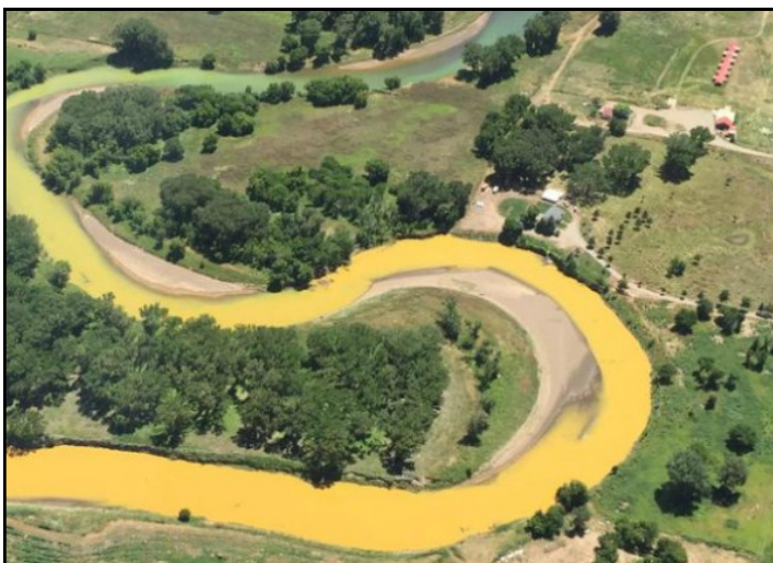
Så här såg Animas River ut efter utsläppet

Inledningsvis lovade EPA att tillhandahålla tankar med färskvatten för boende. Men de tankarna, lånade från lokala oljefältbolag, var förorenade, sade president Begaye. "EPA: s åtgärder under hela katastrofen och till och med nu har varit skamliga", säger han. "Sättet vi behandlades på var oacceptabelt och det pågår fortfarande. Varje dag som går utan komensation är som salt i öppna sår. "