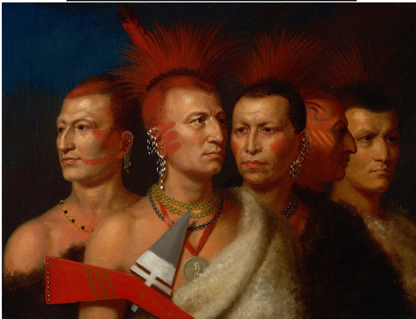
En av de kanske mest kända av Bird Kings porträttmålningar är från 1821 och sägs föreställa de tre hövdingarna Young Omahaw, War Eagle, Little Missouri, samt två Pawnees