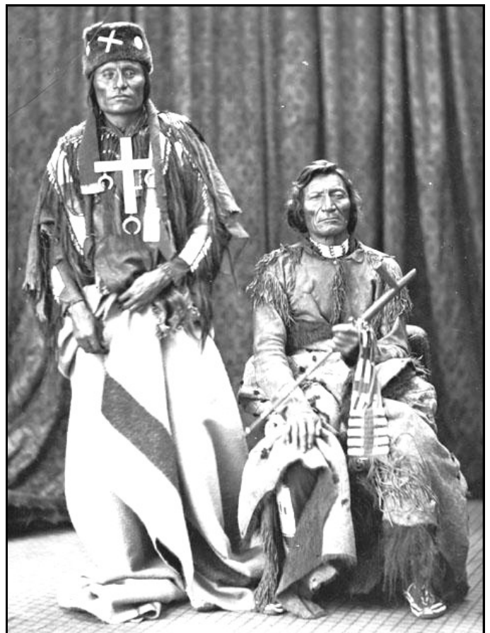
Little Wolf (t.v.)

Det är alltså genom att Dull Knifes efterlevande, och då inte bara den lille sonen han