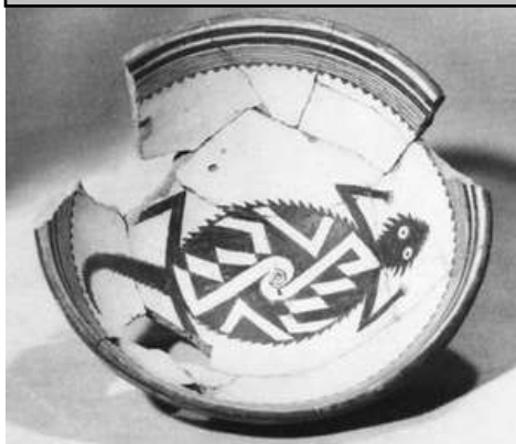
Skål från Mogollonkulturen och dess Mimbresfas 1050 till 1200-talet