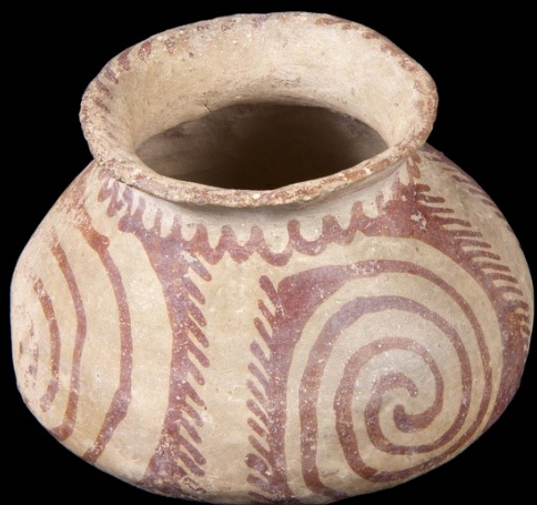
Hohokamkruka 850 till 950-talet

Arkeologer har hittat efterlämningar av keramiska föremål från ett flertal förhistoriska kulturer. Huvudsakligen sådana som Hohokam, Anasazi och Mogollon i sydväst, men också från högkulturer i Mississippiflodens dalgång, som påvisar tydligt släktskap med äldre klassiska kulturer från det Mesoamerikanska områdena. Sådana som Maya, Aztek och Toltek.