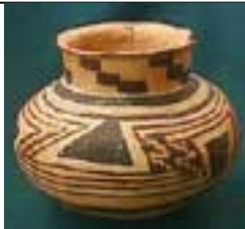
Anasazikruka 1320 till 1400-talet