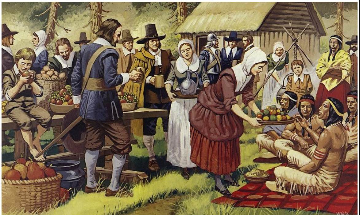
En av ett flertal målningar som ska föreställa hur pilgrimerna och indianerna fredligt delar en måltid

ner och vita undan för undan försämrades, för att slutligen utmynna i ett av de mest fruktansvärda koloniala indianska krigen i historien, King Philip krig. Inte heller speglar det något av Wampanoagstammens överlevnad och hur man anpassat sig under århundradena,