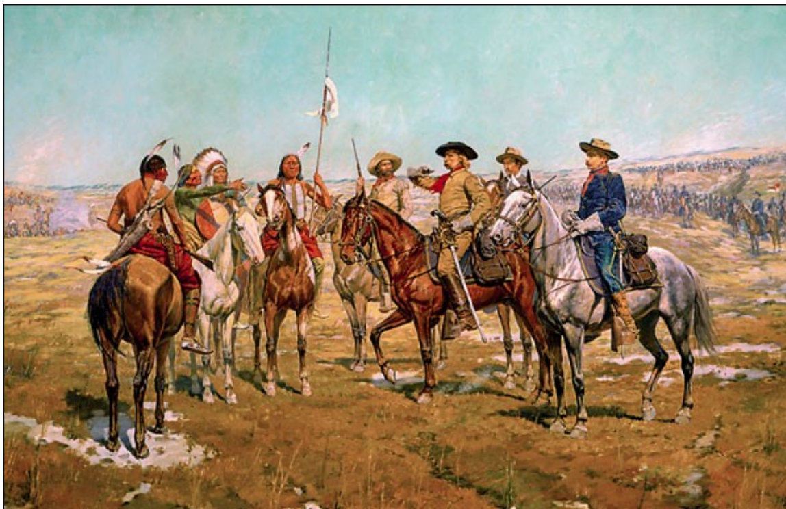
Den dramatiska målningen nedan kallade Schreyvogel "Early Dawn Attack". Den är från 1904